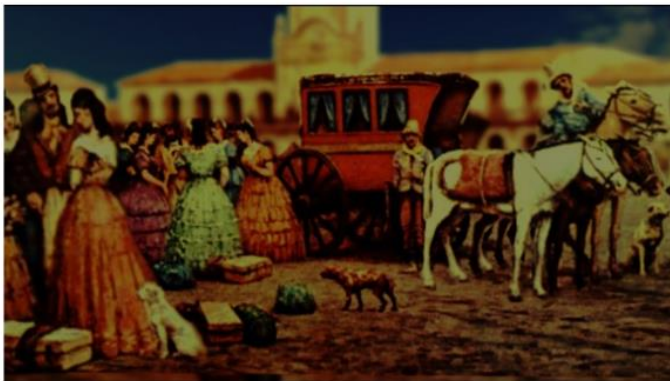
Hace mucho tiempo...